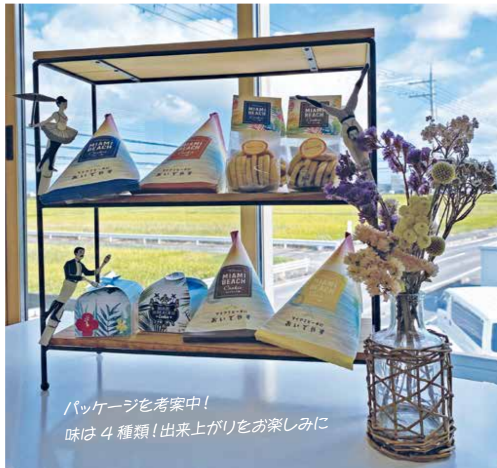
パッケージを考案中! 味は4種類! 出来上がりをお楽しみに

只今 考案中 福祉施設さんとの コラボ お土産用お菓子の パッケージデザイン にっこり作業所 × 奥野印刷株式会社