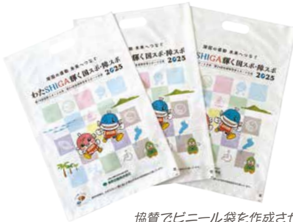
協賛でビニール袋を作成させていただきました!