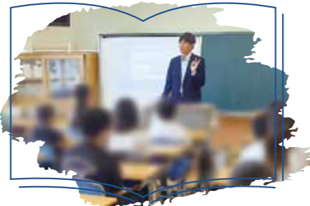
小学生に「税」について 先生しました(✓)

只今 考案中 福祉施設さんとの コラボ お土産用お菓子の パッケージデザイン にっこり作業所 × 奥野印刷株式会社