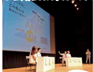
私のパソコン操作で参加 中学生に講演